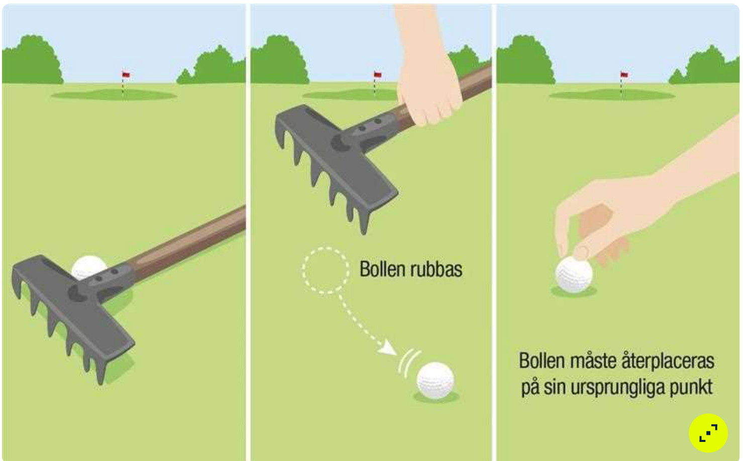
FIG. #2 15.2A: EN BOLL I ELLER PÅ ETT FLYTTBART TILLVERKAT FÖREMÅL